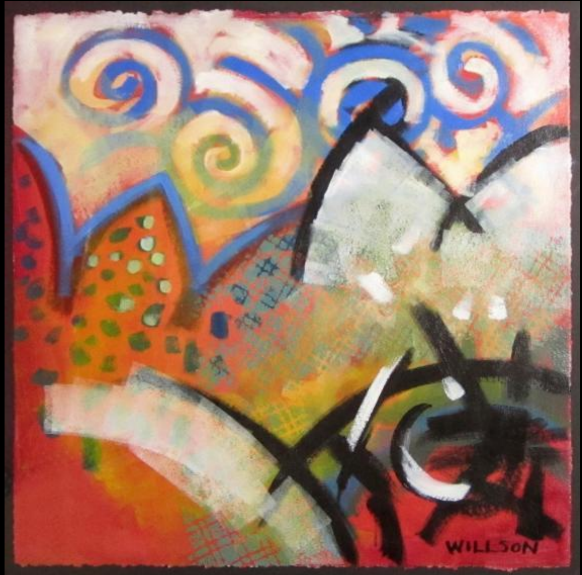
Valerie Willson, On Top of the World , (“En la Cima del Mundo”), óleo sobre lienzo.