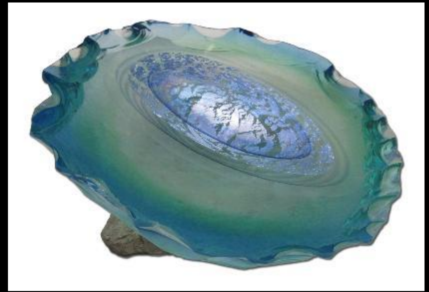
-Curtis Brock, Untitled , ( Sin Título ), vidrio

Vidrio: Trabajo que ha sido manufacturado a mano a través del soplado de vidrio, amoldamiento, fundición, u horno de fusión.