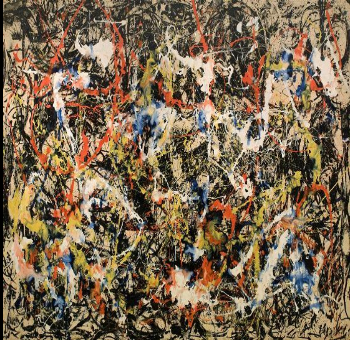
Jackson Pollock, Convergence , (“Convergencia”), óleo en lienzo.