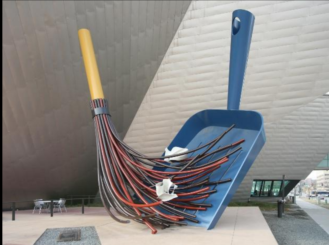
Claes Oldenburg & Coosje van Bruggen, Big Sweep , (“ Gran Barrida ”) acero inoxidable, aluminio, plástico reforzado con fibra, pintado con esmalte de poliuretano.