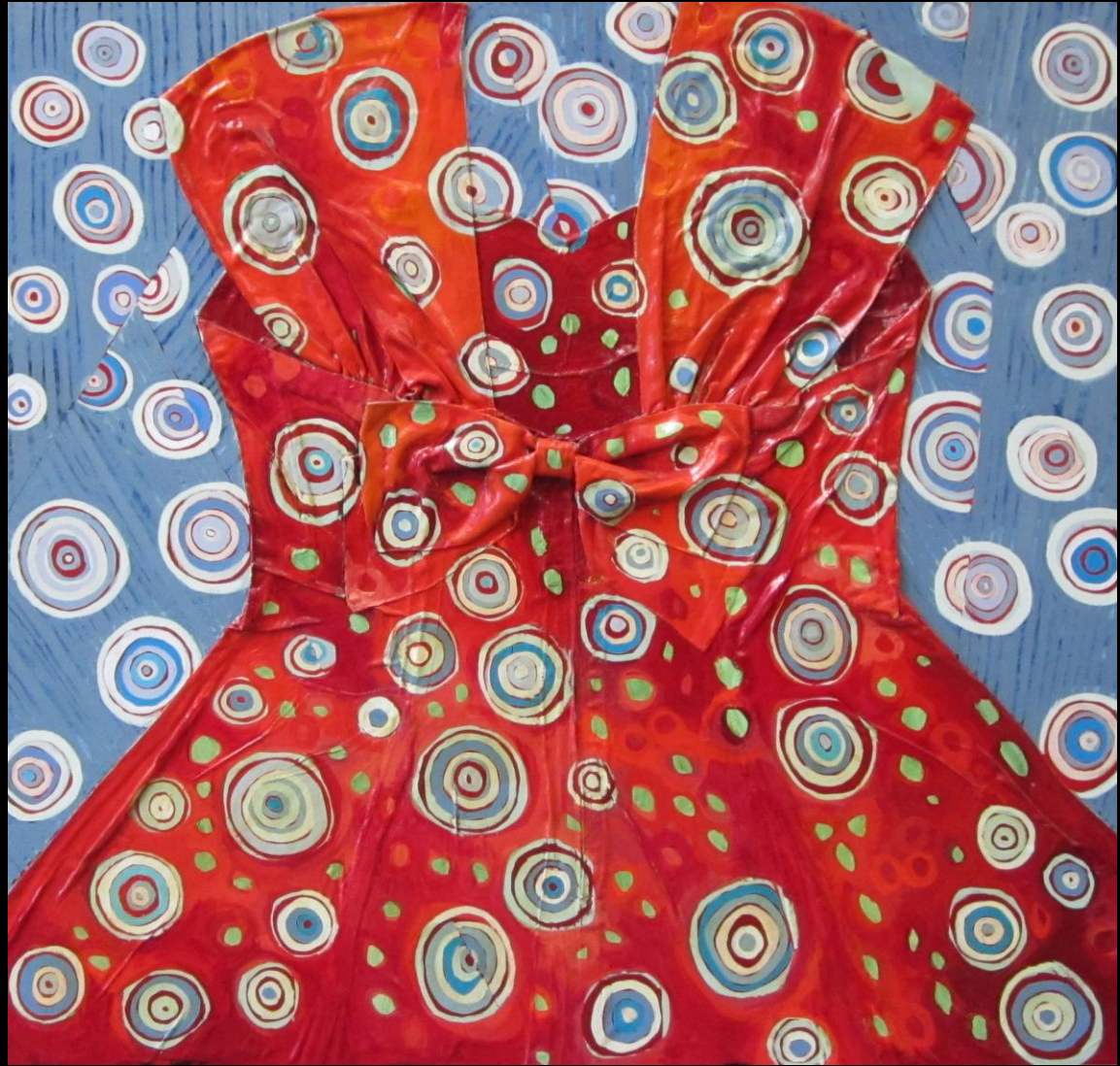
Katherine Allen Coleman, And the Rains Came , (“Y las Lluvias Vinieron”), medios mixtos/pintura