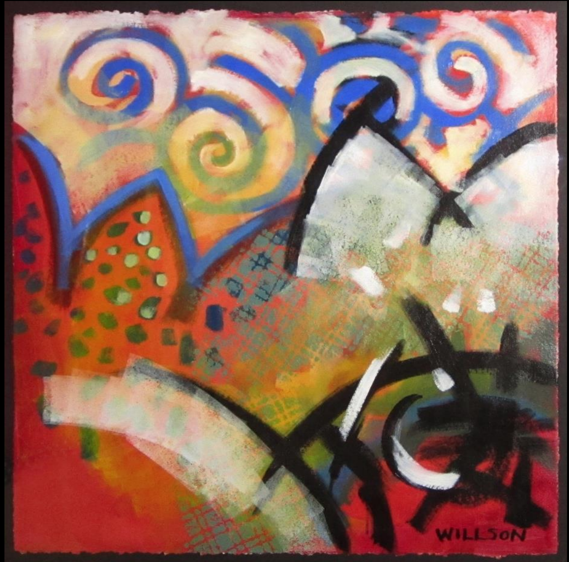
Valerie Willson, On Top of the World , (“En la Cima del Mundo”), óleo sobre lienzo.