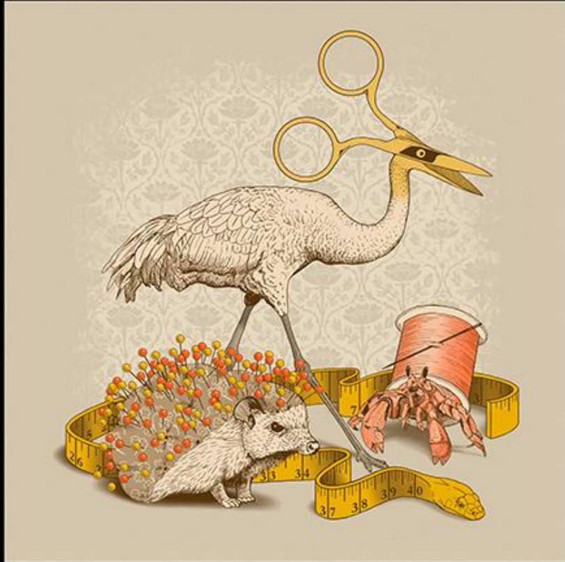
-Jillian Nickell, Alice's Sewing Basket , ("Canasta de Coser de Alice"), serigrafía

Escultura: cualquier obra de arte llevada a cabo en tres dimensiones, donde una masa de material estéticamente inarticulado ha sido manipulada en formas y arreglos significativos mediante técnicas reductoras o aditivas.