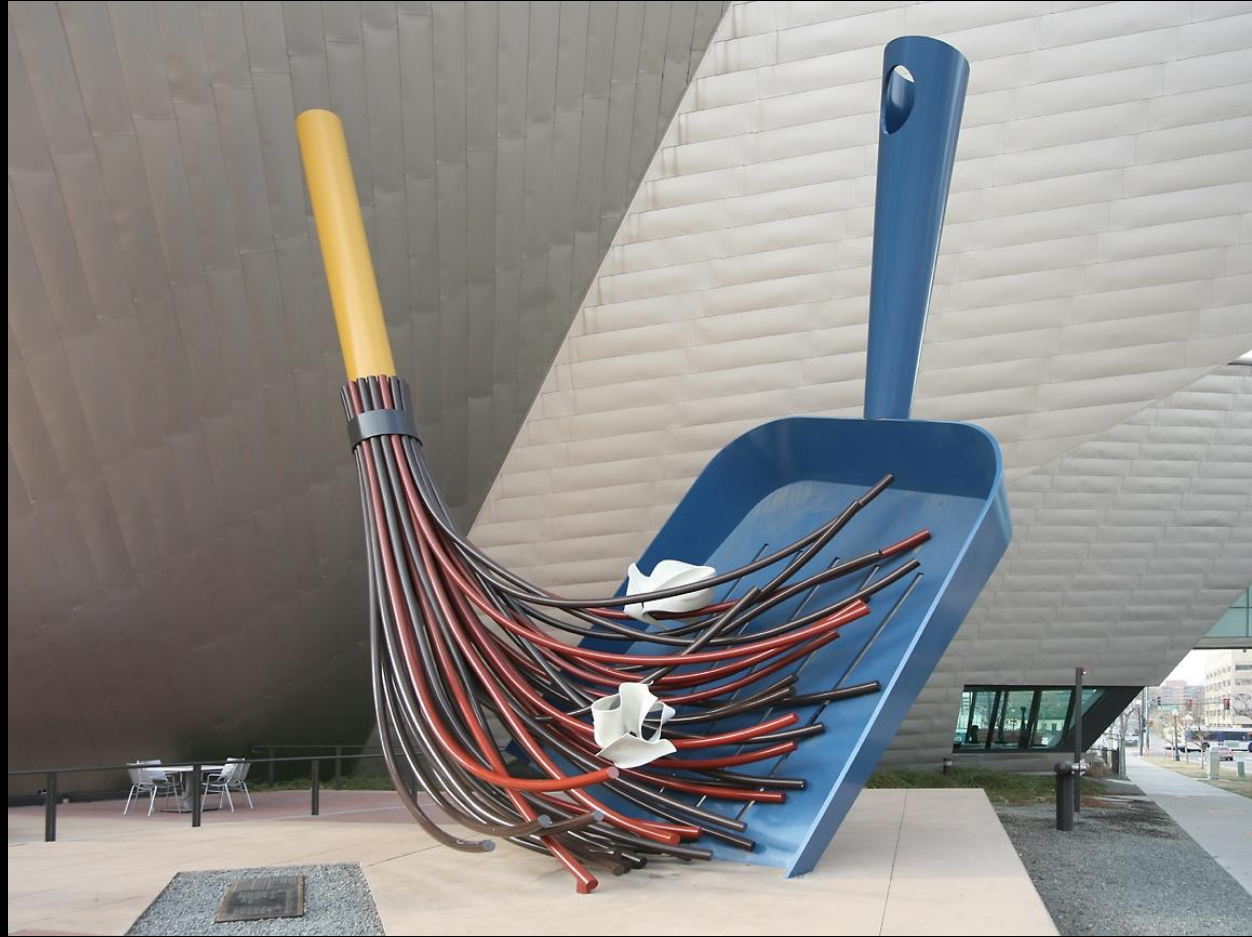
Claes Oldenburg & Coosje van Bruggen, Big Sweep , ("Gran Barrida") acero inoxidable, aluminio, plástico reforzado con fibra, pintado con esmalte de poliuretano.