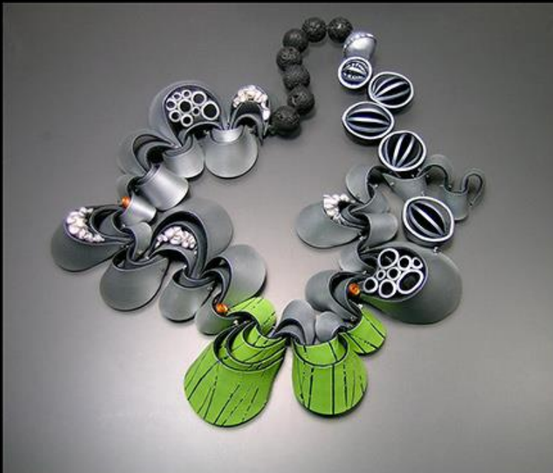
-Wiwat Kamolpornwijit, Ripples , (“Ondulaciones”), polímero

Joyería: El trabajo se produce a partir de metales preciosos, vidrio, arcilla, fibra, papel, plástico u otros materiales. Los objetos están diseñados para el adorno de una persona, tanto funcional como decorativa.