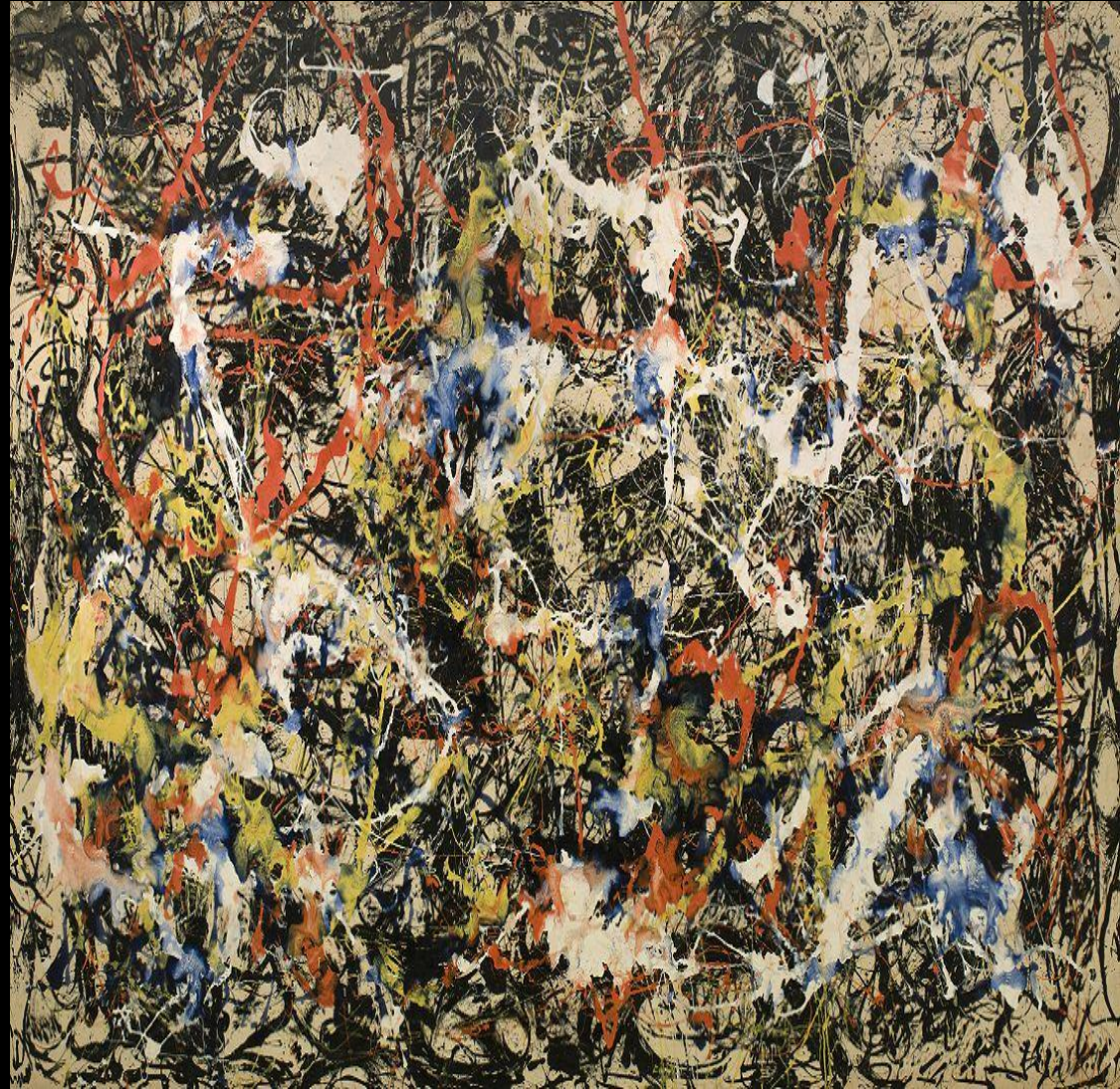
Jackson Pollock, Convergence , (“Convergencia”), óleo en lienzo.