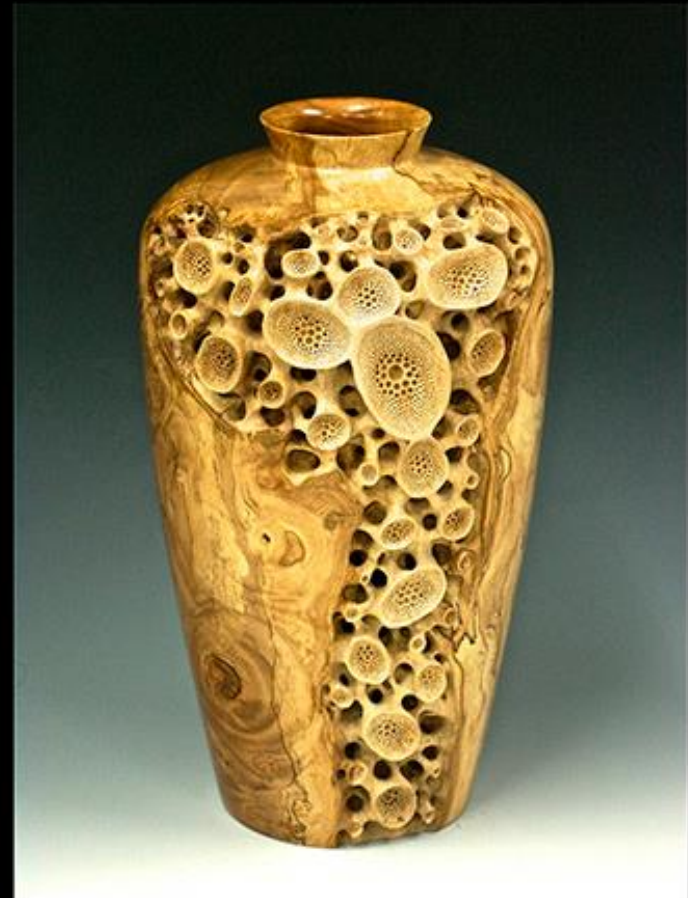
-Mark Doolittle, Beauty Beneath , ("Belleza Interna"), madera tallada

Madera: Se utiliza la madera como material para crear objetos decorativos y funcionales: vasijas segmentadas y torneadas, muebles de madera maciza y laminada, y objetos tallados.